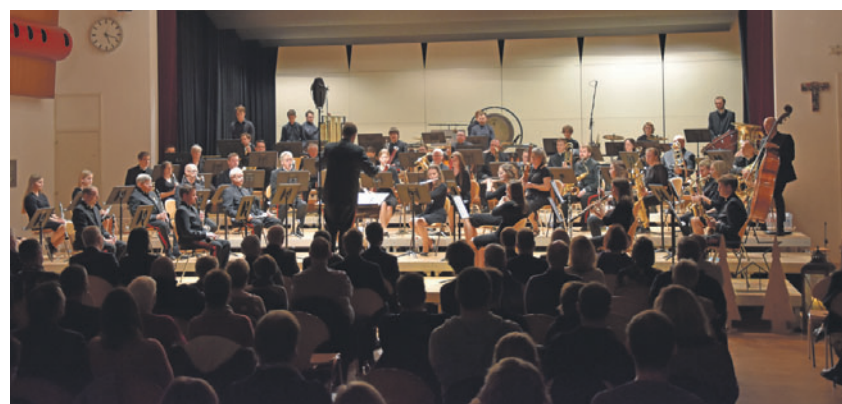
Ein vielfältiges Klangerlebnis erwartet die Gäste am 4. Dezember.

SCHAAN Der Laurentius-Chor freut sich, den Gottesdienst am 1. Adventssonntag um 9.30 Uhr in der Pfarrkirche in Schaan musikalisch zu gestalten. Mit bekannten und weniger bekannten Adventsliedern wollen wir uns gemeinsam auf die kommende Advents- und Weihnachtszeit einstimmen. Beginnen Sie mit diesem Gottesdienst, gemeinsam mit uns, den Advent 2022. Ihr Laurentius-Chor.