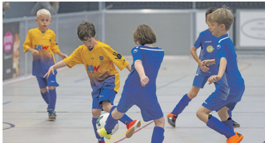
Beim Indoor Soccer Masters ist spannender Nachwuchsfussball garantiert.

TRIESEN Heute wird in der Dreifachturnhalle der Primarschule Triesen das 36. Hestromada Juniorenturnier fortgesetzt. Am vergangenen Wochenende gewannen der USV Eschen/Mauren, der FC Altstätten und der FC Winkeln ihre Kategorien. Eindrücklich waren auch die Spiele der Special Olympics, die von vielen Fans angefeuert wurden und vom Pro Team Thurgau dominiert wurden.