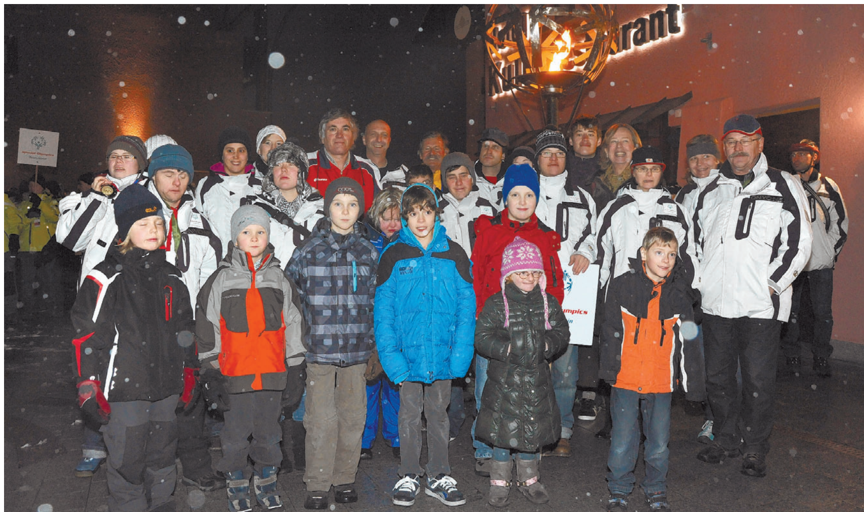
Während zweier Tage standen Triesenberg, Steg und Malbun ganz im Zeichen der vierten Ausgabe der Winterspiele für Menschen mit mentaler Behinderung.

Grossanlass 133 Sportler aus sieben Nationen wetteiferten am Wochenende im Rahmen der Winterspiele 2012 in den Disziplinen Ski alpin und Langlauf um Edelmetallauszeichnungen.