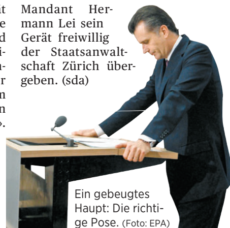
Ein gebeugtes Haupt: Die richtige Pose.