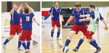
Grosse Emotionen: Ob der Nachwuchs oder die Special Olympics, beim Indoor Soccer Masters in Triesenberg wurde Fussball mit viel Herz zelebriert.

wo man am bewährten Konzept festhält, jedoch die eine oder andere Neuerung präsentieren wird. Vielleicht werden da Nachwuchsteams von deutschen Bundesligisten wie evtl. Borussia Dortmund dabei sein. (mdc)