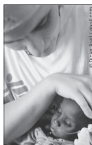
Erste Hilfe für Menschen mit letzter Hoffnung.

Postfach 8032 Zürich www.msf.ch PK 12-100-2