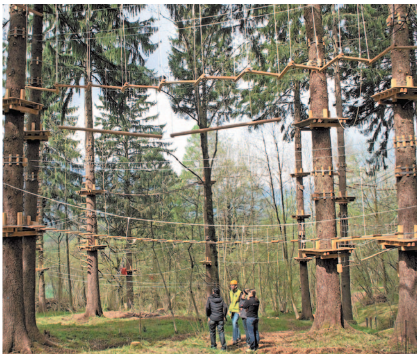
Imposant: Der neue Seilpark im Forst.