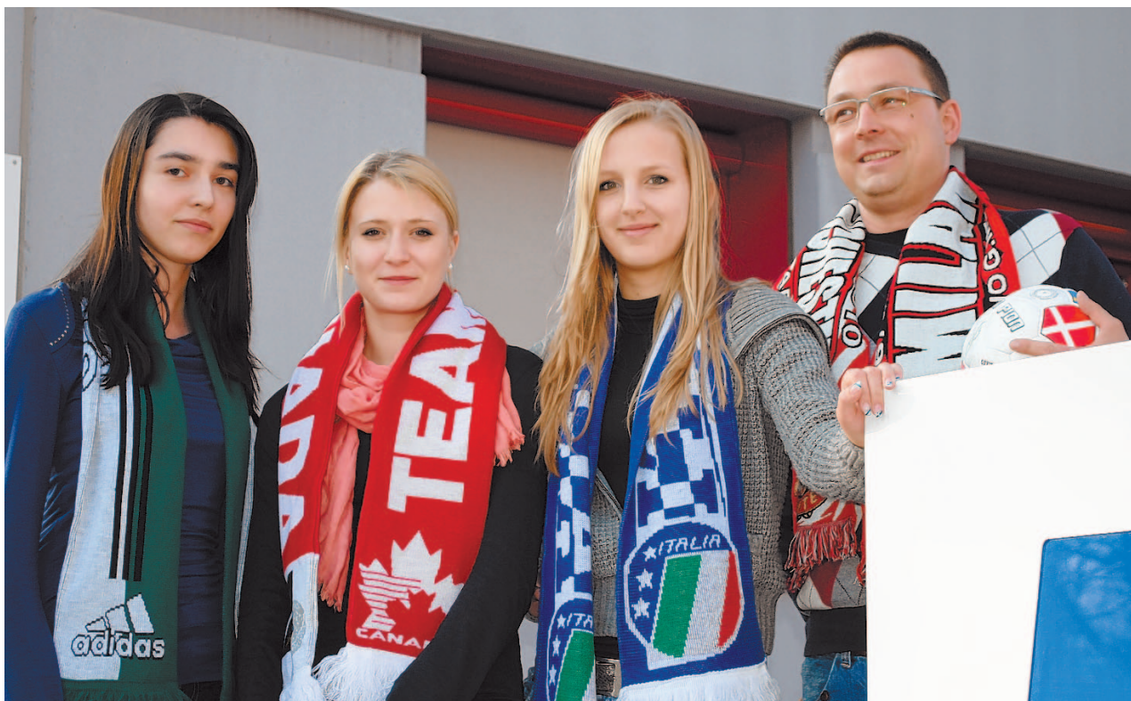
Das Kernteam (Foto) sorgt gemeinsam mit über 30 Lernenden für einen reibungslosen Ablauf der Siegerehrung und ein rauschendes Fest im Anschluss.